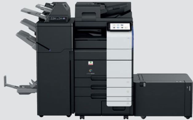
Konfiguration mit Finisher FS-540SD, mit Post-Insertor PI-507 und Anschlusseinheit RU-513, Seitenschublade LU-207