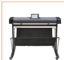
Platzierung auf eigenem, optionalem Standfuß