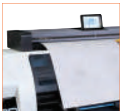
SD One MF ist leicht genug, um auf jeder ebenen Fläche oder einem optionalen, höhenverstellbaren Untergestell platziert zu werden.

SD One MF verfügt über eine integrierte Software zur Druckerverwaltung, über die Sie die Kosten jedes Scans, jeder Kopie oder jedes Ausdrucks nachverfolgen können – perfekt für die Abrechnung nach Arbeitsgruppe oder Kunden.