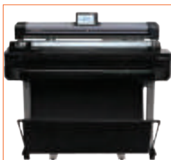
Optionales höhenverstellbares Untergestell zur Platzierung auf dem Drucker.