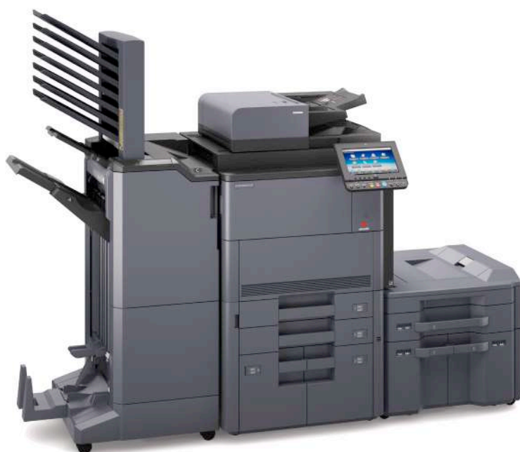
d-Copia 8001MF mit Optionen PF-740 + PF-7130 + DF-7110 + MT-730 + BF-730