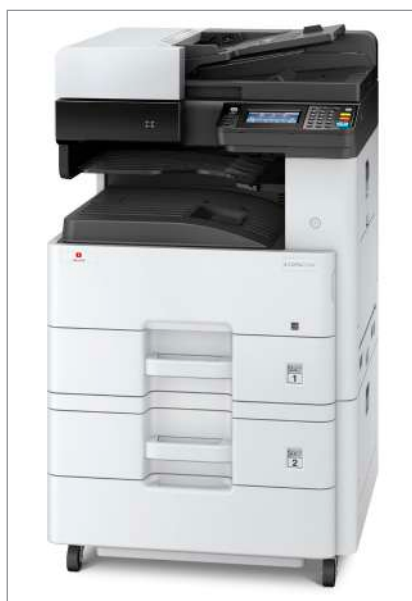
d-Copia 255MF mit optionaler Papierkassette PF-470