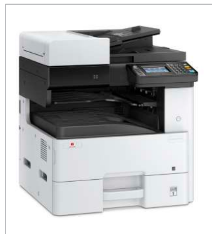
d-Copia 255MF Standardkonfiguration