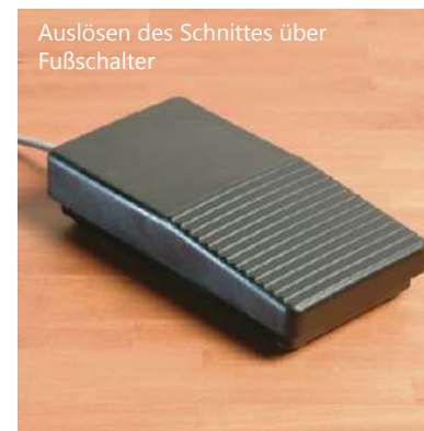
Auslösen des Schnittes über Fußschalter