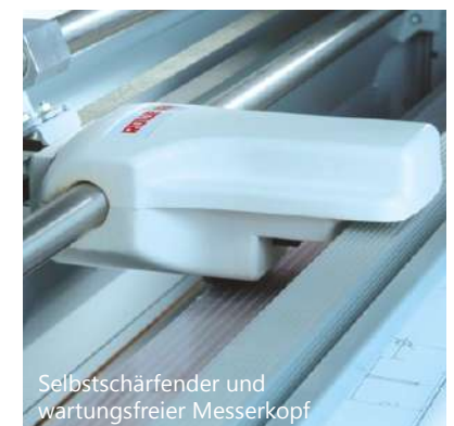
Selbstschärfender und wartungsfreier Messerkopf