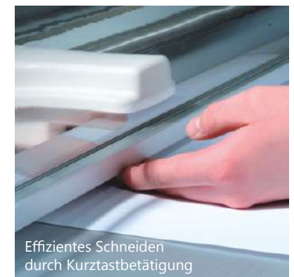
Effizientes Schneiden durch Kurztastbetätigung