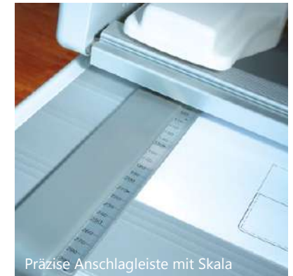
Präzise Anschlagleiste mit Skala